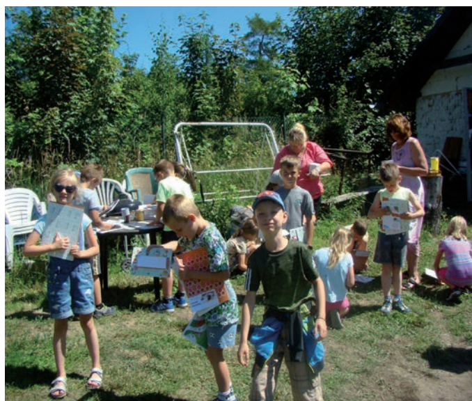
Žáci při povídání o včelách