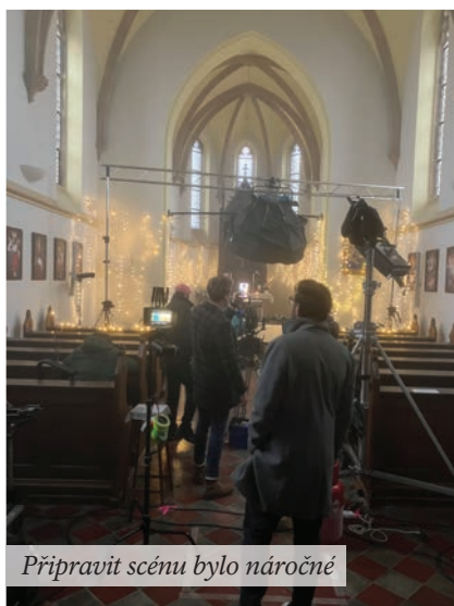
Připravit scénu bylo náročné