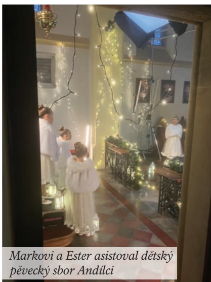
Markovi a Ester asistoval dětský pěvecký sbor Anďilci