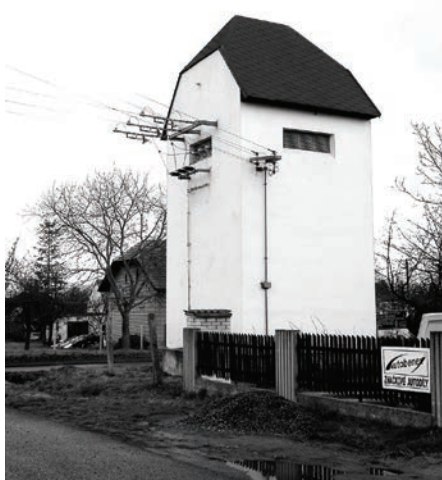
První symbol - původní transformátor v dnešní podobě