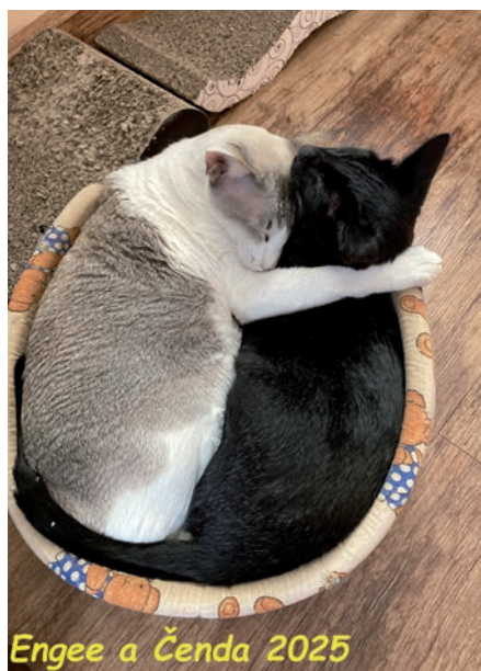
Engee a Čenda 2025

Bohužel, silnice (nebo pole) před domem, se mu dopoledne 19. 8. 2025 stala osudným. Napadl ho agresivní pes, který nebyl na vodičku a před kterým Čenda nestačil utéct. Slyšet bylo nevráživé a bojovné štěkání psa a hlas majitelky, která ho okřikovala (přes stromy nebylo na silnici vidět). I přes to, že pes Čendu vážně zranil, ten ještě stačil přeskočit plot na zahradu, kde jsme ho asi po dvou hodinách našli mrtvého